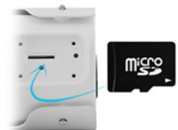
AUFNAHME AUF EINER MICRO SD-KARTE