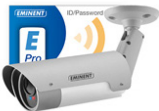
BETRIEBSBEREIT IN 3 SCHRITTEN