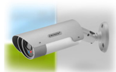
FÜR DEN AUßENBEREICH