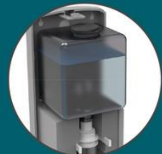
Fassungsvermögen 1000 ml