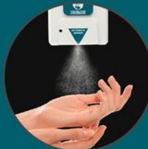
Feiner, großflächiger Sprühnebel

* Netzteil nicht im Lieferumfang enthalten